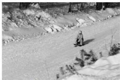
Б – санный спуск