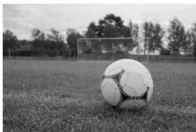
А – футбольное поле

Ж. Какой из изображённых на фотографиях объект может быть сооружён на участке, по которому проходит маршрут А–В? Обоснуйте свой ответ.